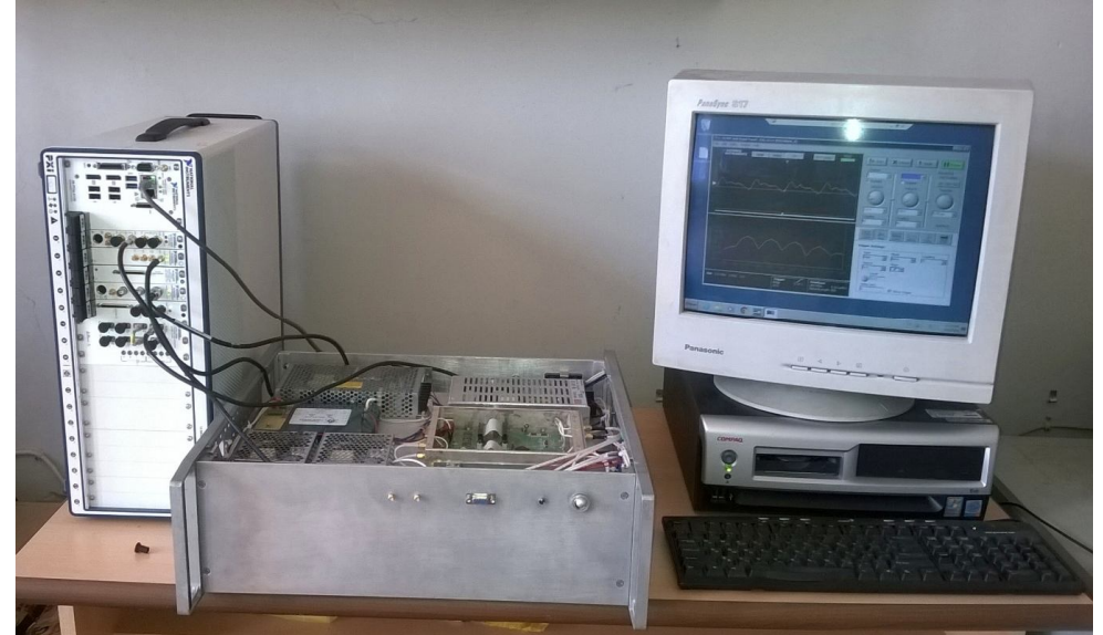
Ռադիոհաճախային պլազմայի ազդանշանի համաձայնեցման համակարգի սպեկտրալ առանձնահատկությունների ուսումնասիրում